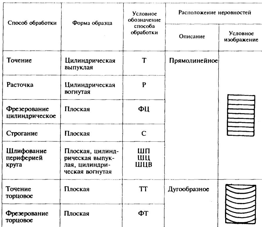
Т а б л и ц а 1

4.1 Способы обработки, воспроизводимые образцами, форма образца и основное направление неровностей поверхности образца должны соответствовать указанным в таблице 1.